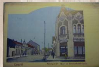
Ceglédi Panoráma, XI. évf. 3. sz., 2017. február 10., 4. o.