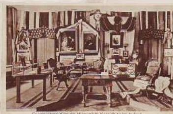
Ceglédi városi Kossuth Múzeumból Kossuth Lajos házában.